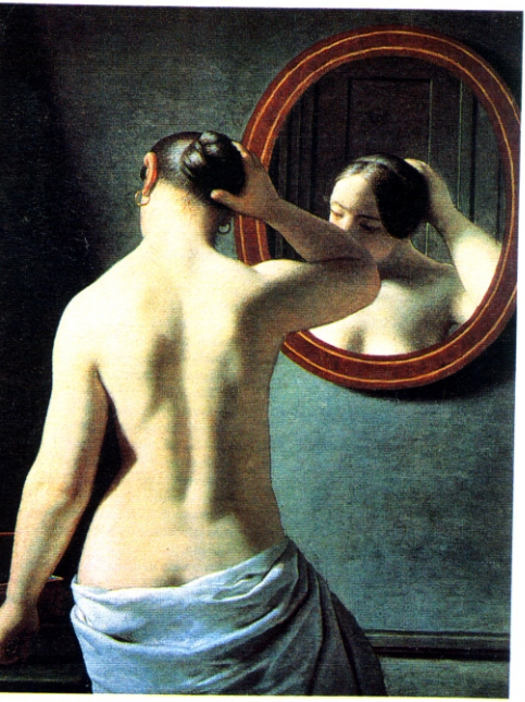
Desnudo en el espejo, pintura del danés C. W. Eckersberg. Statens Museum for Kunst, Copenhague. (ICDA)