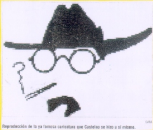
Reproducción de la ya famosa caricatura que Castella se hizo a sí mismo.