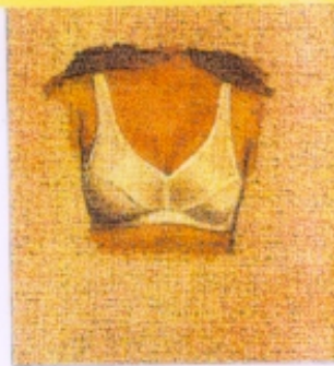
F. X. González: Soutien-gorge, 1999