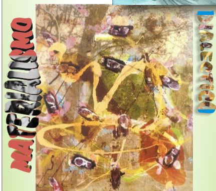
“Los tres bucles” Jorge Galindo