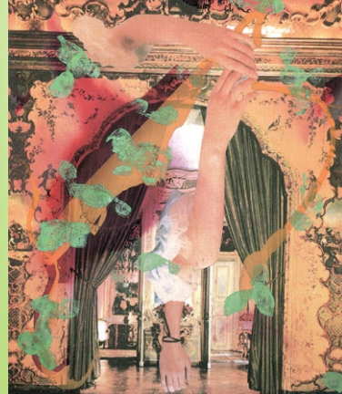
“Hada de la filigranas”_ Jorge Galindo (2003)