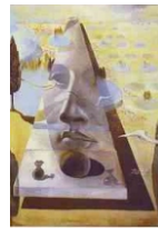
Dali, Salvador: "Gesicht der aphrodite von cnida"