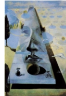
Dali, Salvador (1981): "Apparition du visage"