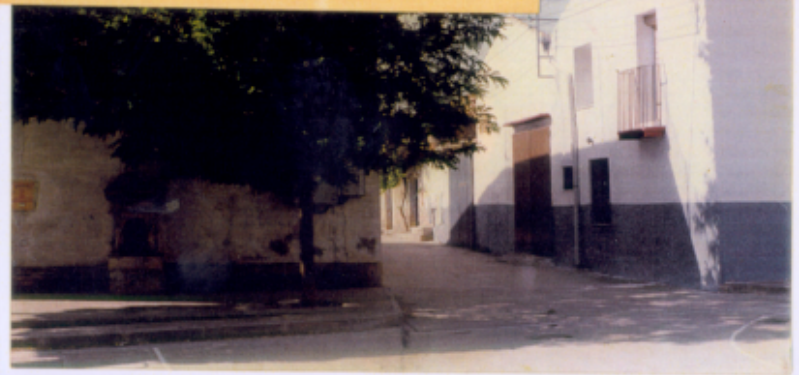
(Pintura de Ms Eugenia 1993-Ourense)