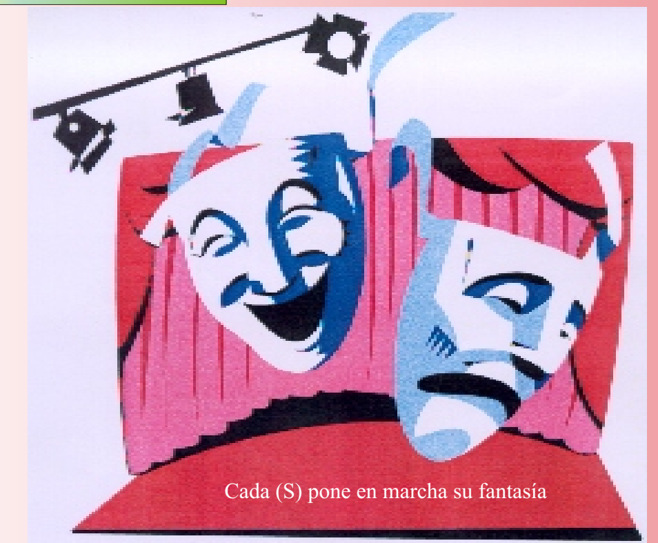
Cada (S) pone en marcha su fantasía

* Generar pautas para pasar del espacio SIMBOLICO al IMAGINARIO