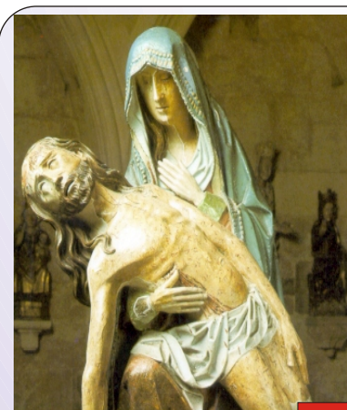
Pietà: Dolor absoluto.