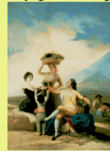
El otoño (Goya XVIII)

El niño vestido siempre como un pequeño adulto, se desprende un poco del marco familiar...se lo descubre en la naturaleza, jugando en grupo, con los animales