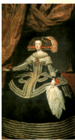
Reina Dña Mariana de Austria Velazquez (XVII)