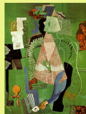
Retrato de niña (Picasso XX)

Se trata de niños de guerra, en la miseria...la actitud es desesperadamente convencional. Hasta el cubismo se observa una expresión melancólica de la infancia.