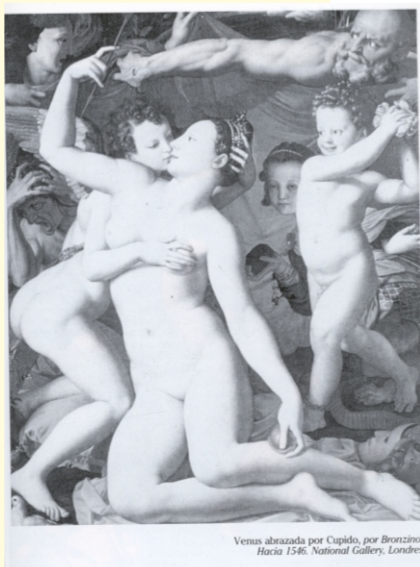
Venus desnuda por Cupido, por Braccio, Hacia 1560, National Gallery, London