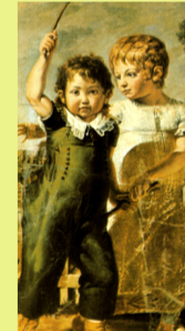
Los niños de Brno (Goya XVIII)

hay que esperar hasta el siglo XIX para que aparezca el solo en traje de colegial con actitudes de niño.