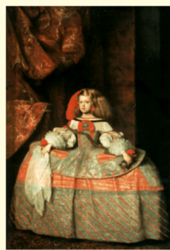
Infanta Dña Margarita de Austria

En esta época no se dice del niño que ha muerto... fallecido como de un adulto se hiciera...se dice que la familia ha perdido objetos...no se habla de ellos como individuos que habían cesado de vivir