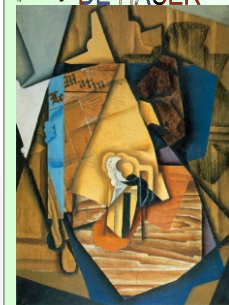
Juan Gris: "Man in the Cafe" (1912)