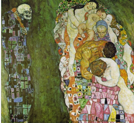
Gustav Klimt: "Death and Life" (1916)