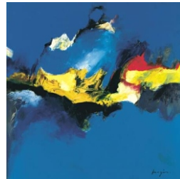
Magis Pascal: “Variations-abstraites-IV”