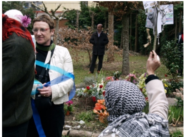
nuevos esquemas de integración... Transformando los marcos de referencia.