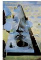
Dalí, Salvador (1981): “Apparition du visage”