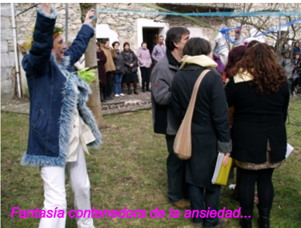
Fantasia contenedora de la ansiedad...