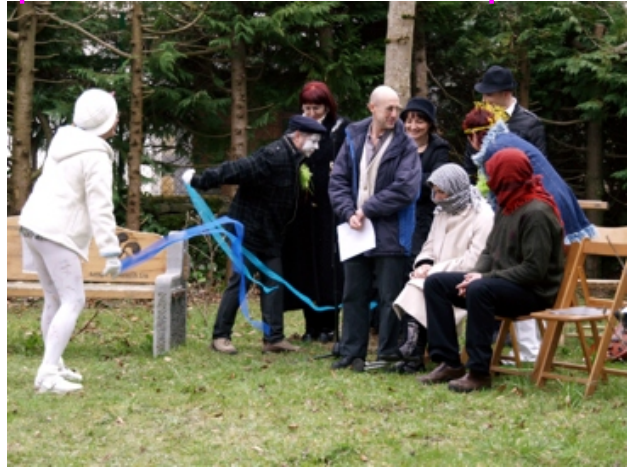
Fantasías: primeros Organizadores-Operadores de la Subjetividad del (S)