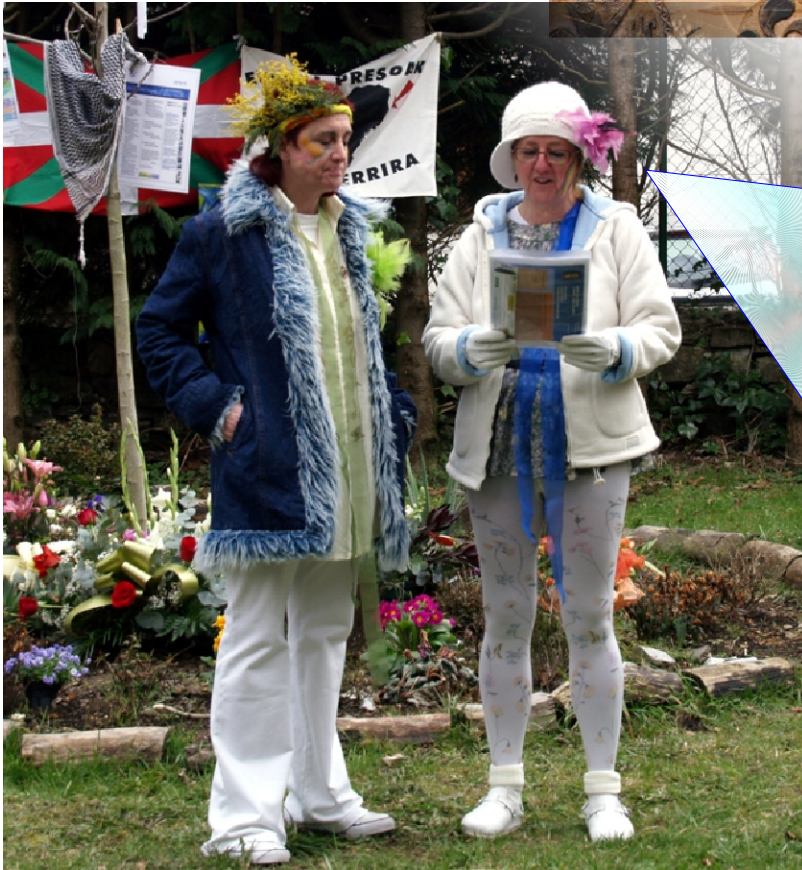
El (S) no posee Patronos Cognitivos para Referentizar la Fantasía

Para facilitarle el aspecto a ese reino de "lo no hollado, lo inaccesible y no alcanzado", siempre en constante "formación, transformación/recreación eterna de la mente eterna", Mefistófeles da a Fausto una llave insignificante que crece al contacto con su mano y que habrá de indicarle "el camino justo".