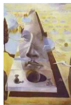
Dalí, Salvador: “Gesicht der aphrodite von cnida”