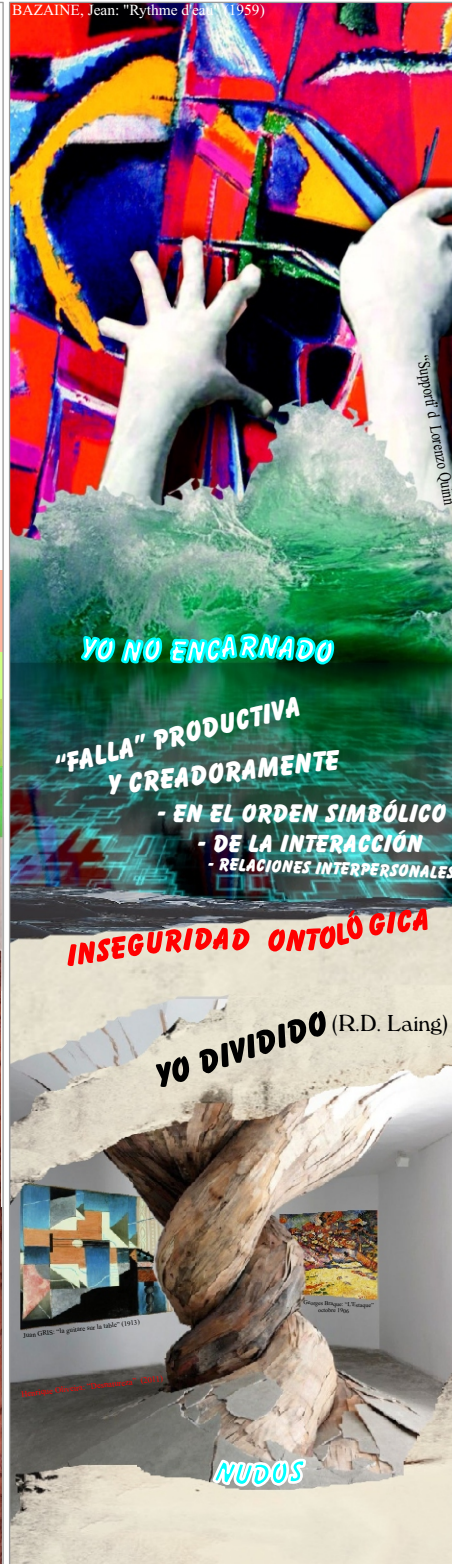
BAZAINE, Jean: "Rythme d'eau" (1959)

editado en el apartado de Psico(pato)logía de la página web www.joseluisdelamata.com .